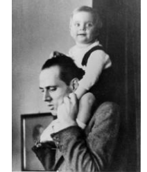
Helmuth James Graf von Moltke