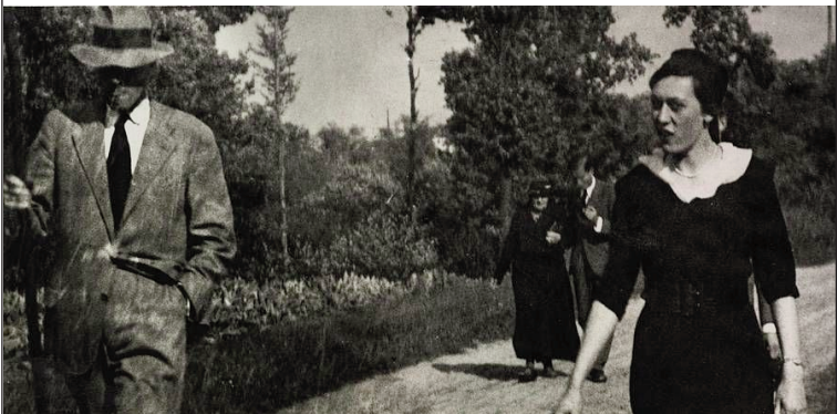
Helmuth James und Freya von Moltke, 1935